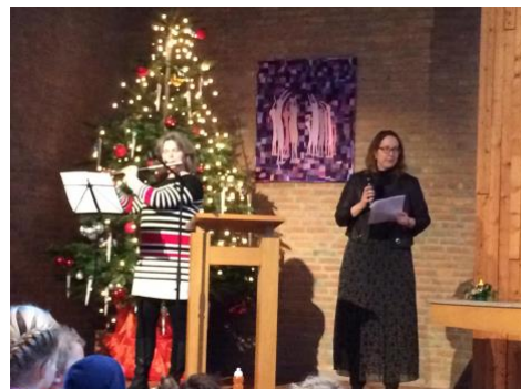
Kerstviering in de kerk