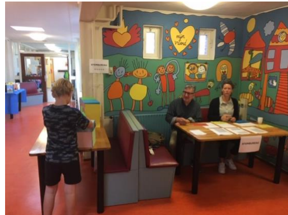
Stembureau voor de verkiezingen van het kinderparlement

voorafgaand aan het praktisch fietsexamen voor groep 7. Ook in de komende jaren zullen aanvullende verkeerslessen aangeboden worden.