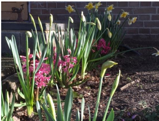
In het najaar geplante bollen zorgden voor een kleurrijke tuin in het voorjaar

Al vijf jaar is ons TuinTeam actief aan het werk om onze tuin in te richten en te onderhouden. Het tuinteam houdt zich bezig met beplanting en het onderhoud van de tuin. Dit jaar heeft het TuinTeam met alle groepen bollen gepland, die in het voorjaar prachtig opkwamen.