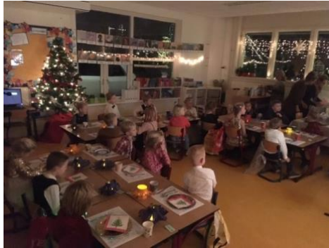
Kerstdiner in de klassen

het schoolplein met kinderen, ouders en team.