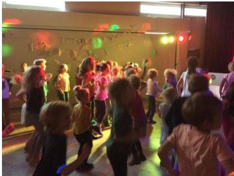
Kinderboekenweek: het vriendschapsfeest

extra activiteiten. De clinics, die voorheen bij de verenigingen plaatsvonden, hebben we anders georganiseerd om de druk op het lesrooster en de vraag naar ouderhulp te verminderen. Waar mogelijk werden de clinics wel gegeven, maar binnen de reguliere gymles en in de eigen zaal of op het veld. Er werden meerdere sportevenementen georganiseerd, zoals schoolvoetbaltoernooi, sportdag, scholierenbosloop, tafeltennisfeest, basketbaltoernooi en schaatsen. Sommige activiteiten waren een onderdeel van het lesprogramma, andere waren op vrijwillige basis. Voor het eerst deden de groepen 5 tot en met 8 mee aan de Koningsspelen op het strand van Bloemendaal. Later in het jaar hadden zij het slagbaltoernooi. De groepen 1 t/m 4 hadden hun eigen sportdag.