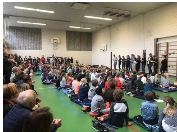
Presentatie van de liederen: project muziek en dieren

Ook de creatieve vakken hebben een plaats binnen de school. De vakken dans, drama, tekenen, handvaardigheid en muziek worden afwisselend gegeven. In het kader van kunst en cultuur is er een jaarlijks terugkerend aanbod via de gemeente Bloemendaal. Elke groep heeft een voorstelling bijgewoond of een workshop aangeboden gekregen.