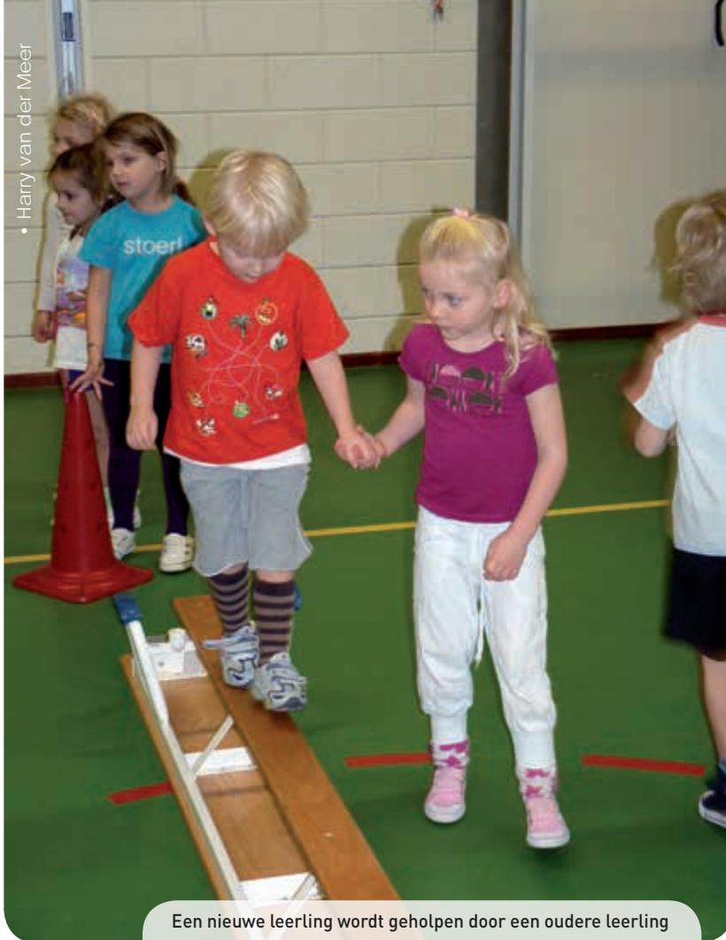
Een nieuwe leerling wordt geholpen door een oudere leerling

In een groepjesles worden binnen één les verschillende activiteiten aangeboden. Meestal gaat het om drie tot vijf activiteiten die tegelijkertijd plaats vinden. De grootste voordelen van zo'n groepjesles zijn: