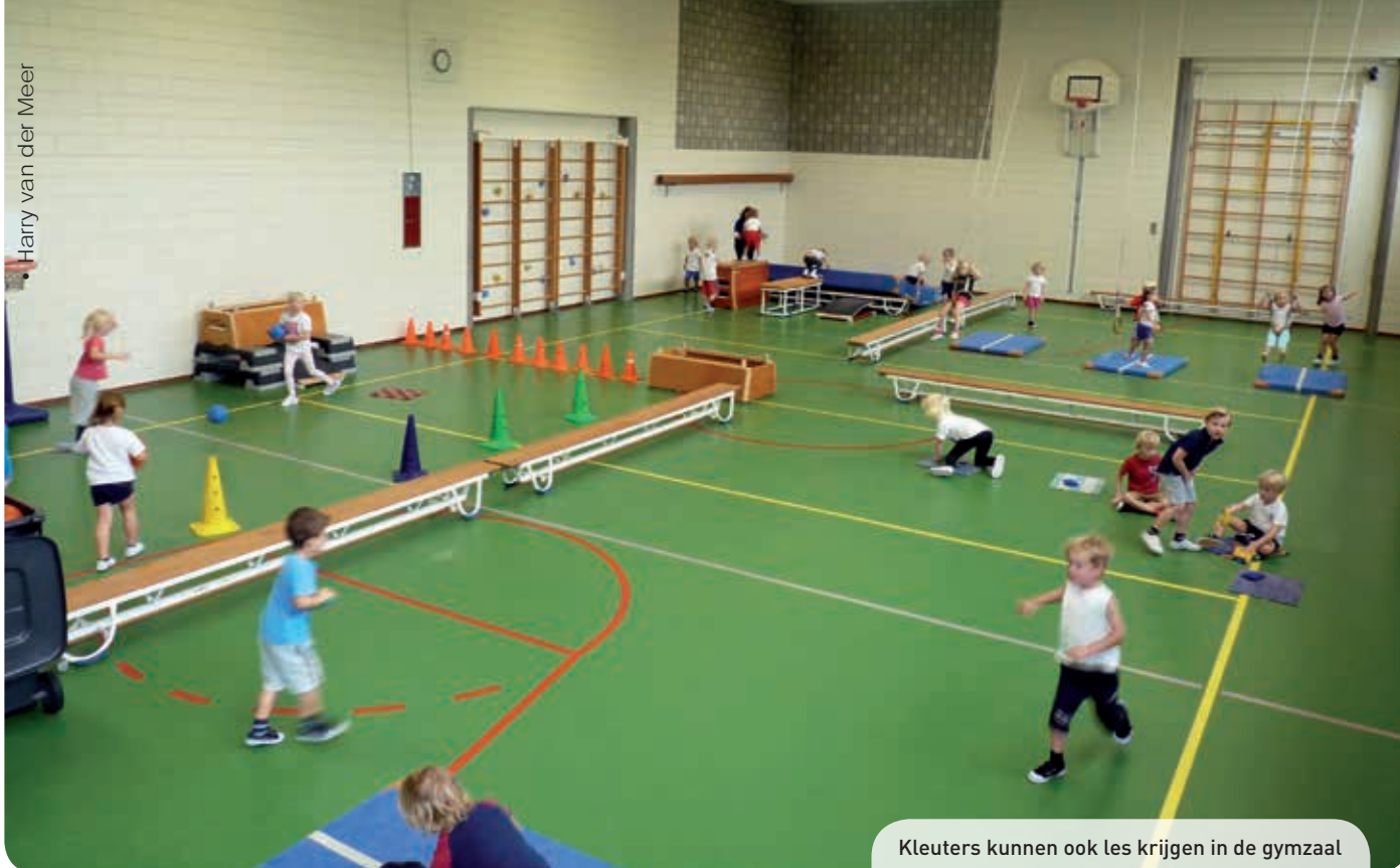
Kleuters kunnen ook les krijgen in de gymzaal

viteiten aan bod te laten komen. De ruimte in het speellokaal is immers beperkt.